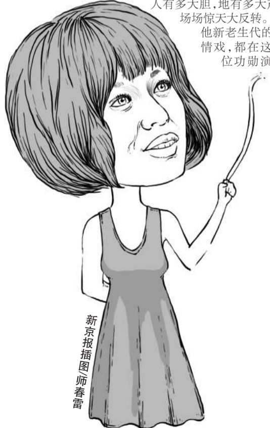
新京报插图 师春雷