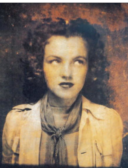
母亲格拉迪斯(左一)患有严重的精神病,没有独立抚养女儿的能力。年幼的诺玛·珍在多个寄养家庭中长大,这组照片分别是2岁、7岁、12岁时的梦露(左二起)。