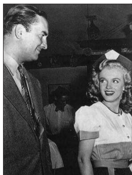
【电影】 《危险年代》 Dangerous Years

梦露曾经说过，好莱坞是一个愿意花5000美元买你一吻而只花50美分买你灵魂的地方。在这个世界最势利、最残酷的名利场上，梦露不仅站稳了脚跟，拥有了一席之地，并且开创了属于自己的时代。从开始到结束，她只用了短短的十六年的时间，领衔主演的也不过十余部电影。就让我们从头回顾一下她的好莱坞之路，看看梦露是如何做到的。