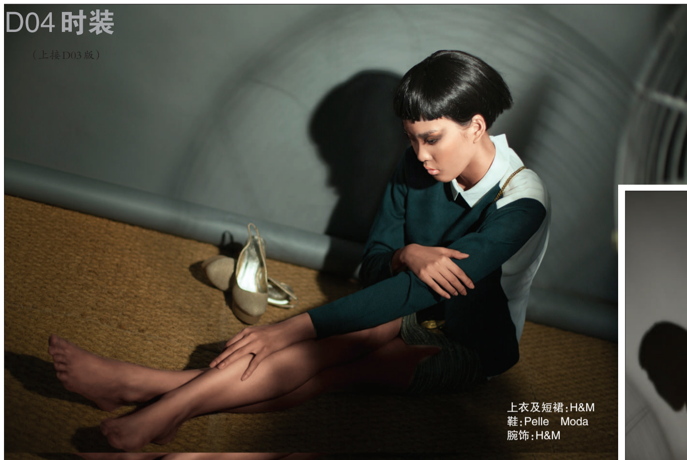
上衣及短裙:H&M 鞋:Pelle Moda 腕饰:H&M