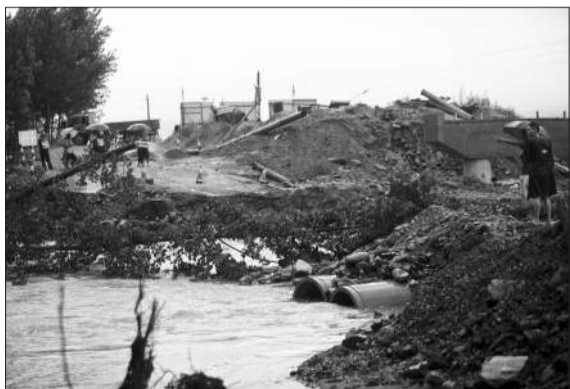
迷雾桥正在施工，边上的便道被大雨冲毁。