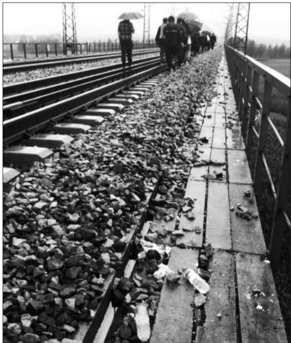
事发后，相关部门领导来到事发点勘查。