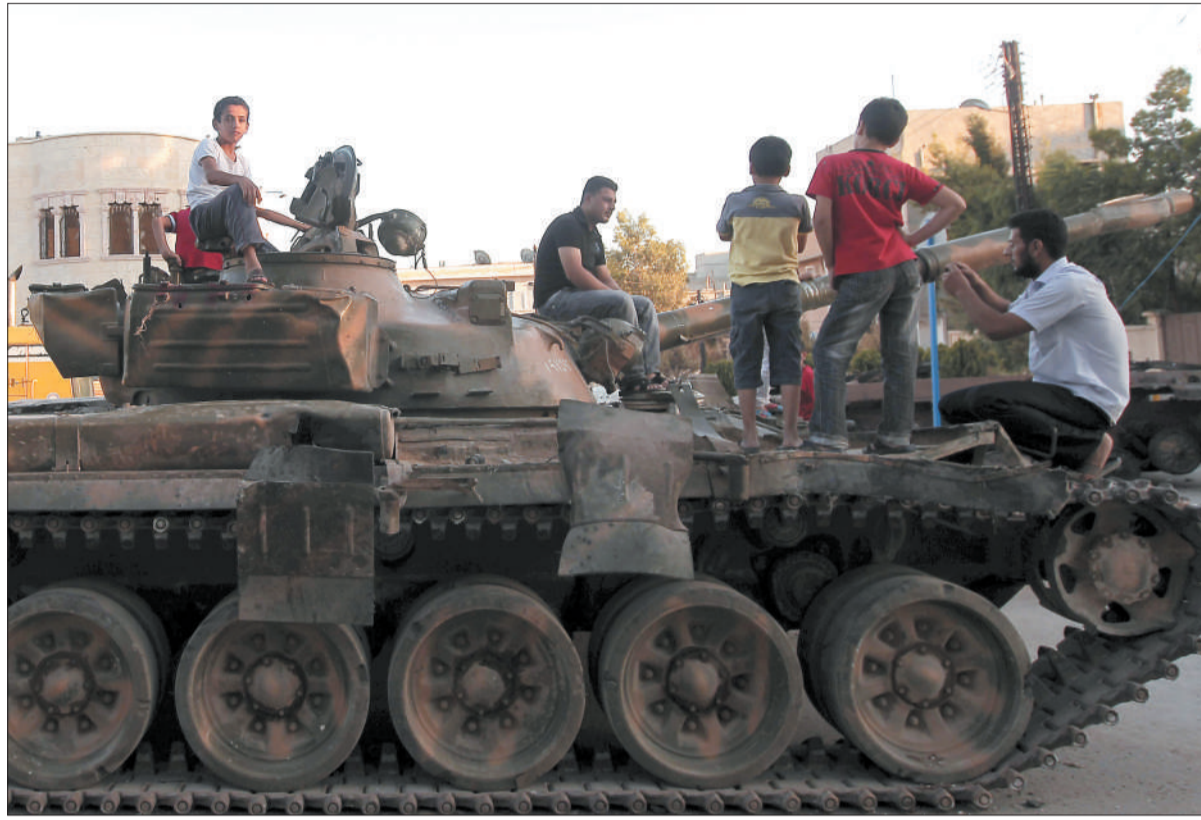
8月2日，叙利亚第二大城市阿勒颇的北部地区，一些叙利亚民众爬上政府军丢弃的坦克。