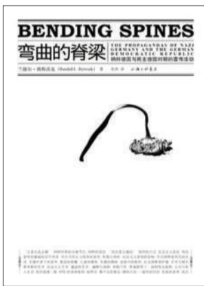
《弯曲的脊梁》 兰德尔·彼特沃克 著 上海三联书店 2012年6月 38.00元

美国的传播学教授兰德尔·彼特沃克,长期关注德国的宣传史,即纳粹德国和东德。他搜集了大量的德国宣传资料和影像,公布在自己创建的“德国宣传”网站上。仅凭这一点,作者积累原始资料的贡献便功德无量。对于中文世界而言,以组织和宣传角度切入研究极权体制的专著几乎没有,所需信息和分析都得在其他书籍里面零碎寻找,这本书为我们在特定领域打开了一个世界。