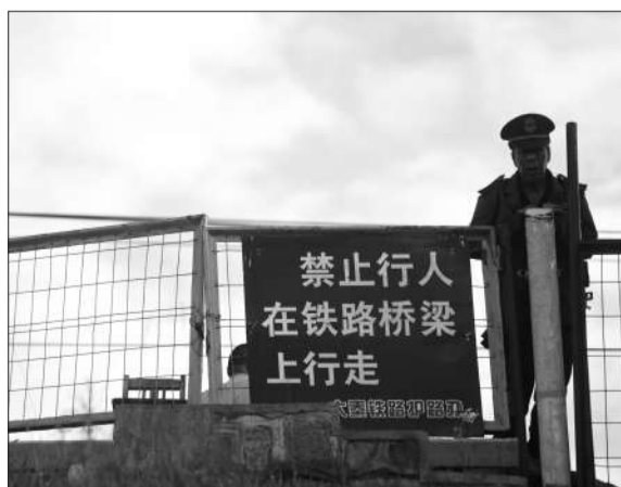
看守岗亭的工作人员。

多名家住迷雾高架桥西侧巨各庄的村民称,撞人事故后这几天,过路的火车增加了措施——过桥时不光放缓速度,过桥前还会大声鸣笛,“以前可不是这样”。