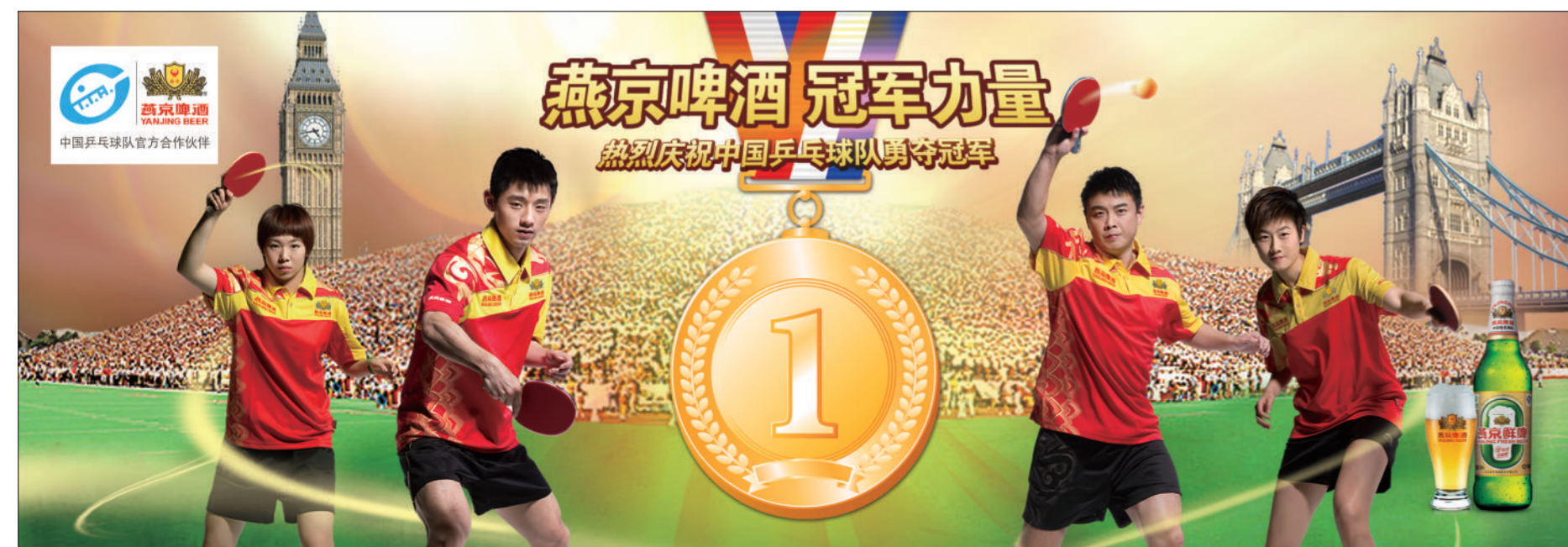
责编 祝炳琨 颜颖颖 图编 倪华初 美编 俞丰俊 魏冬杰 责校 付春惜 徐晓

纽约田径大奖赛是北京奥运会前重要的检验之战,刘翔赛前突然宣布退赛。他在训练中感到右腿肌肉酸痛,专业说法是“大腿后群肌肉隐性拉伤”。为防止在雨天比赛出现意外,加重伤势,刘翔决定退赛。随后一个多月,由于伤势影响,刘翔的训练强度一直未能恢复到受伤前的水准,也极大地影响了他的奥运备战。