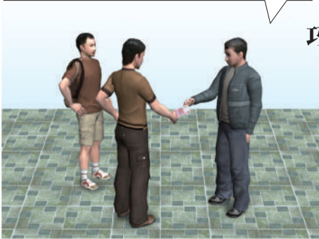
巧家爆炸案示意图