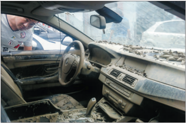
竞拍者查看一辆水淹的宝马车况。