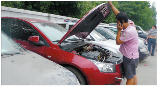
8月7日,拍卖大厅外,竞拍者查看一辆水淹的科鲁兹车况。