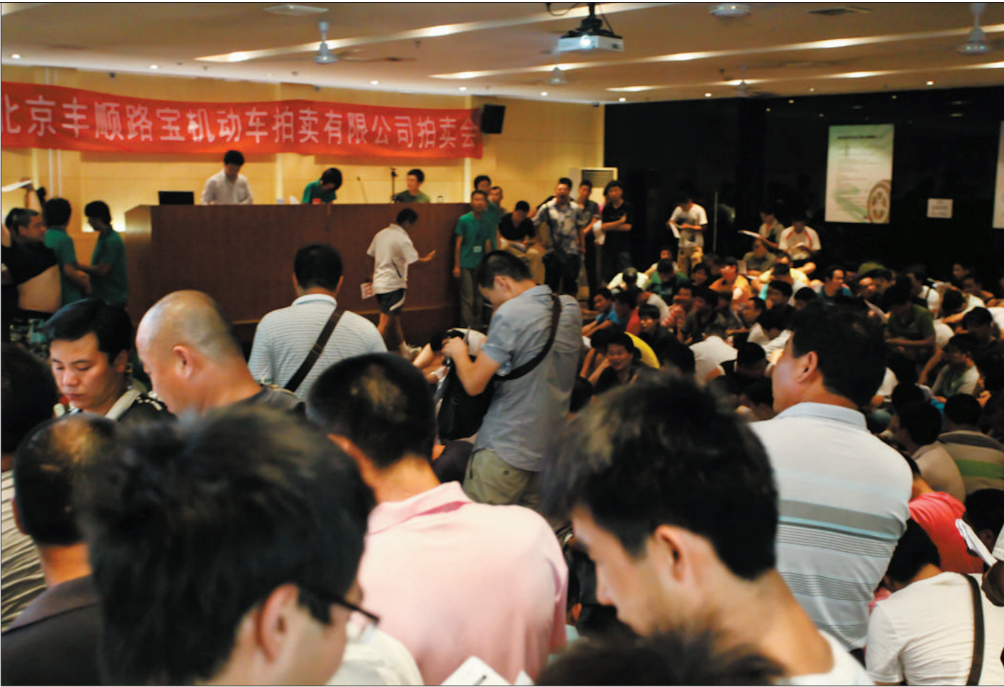
8月7日,路宝拍卖公司的拍卖大厅,挤满了水淹车竞拍者,他们多数来自外地。