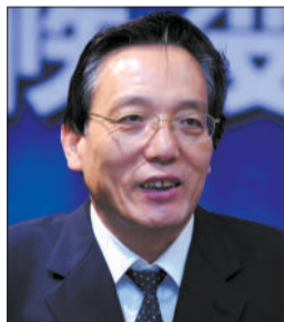
国研中心副主任刘世锦

据新华社电 国务院发展研究中心副主任刘世锦昨日表示,中国经济有可能会逐步减速,进入中速发展期。他是于8日在京召开的“襄阳发展战略规划评审会”上做上述表示的。