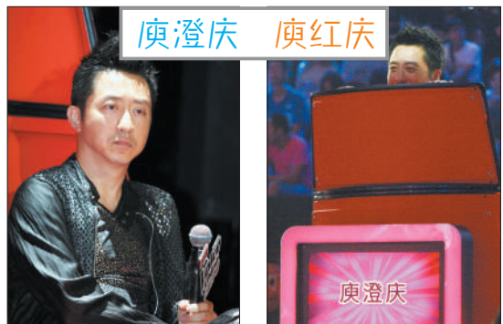
庾澄庆通过《中国好声音》再次火了一把。