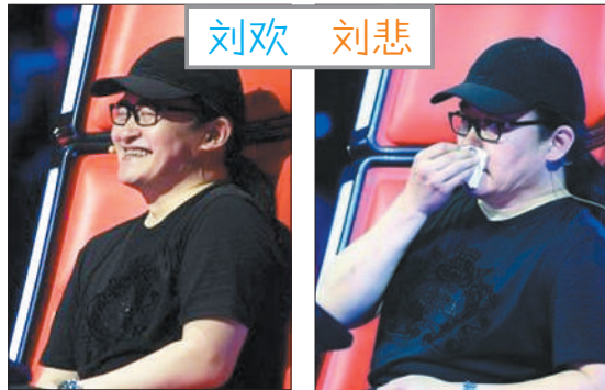
当评委后的刘欢喜欢闹情绪了,时不时感动流泪。