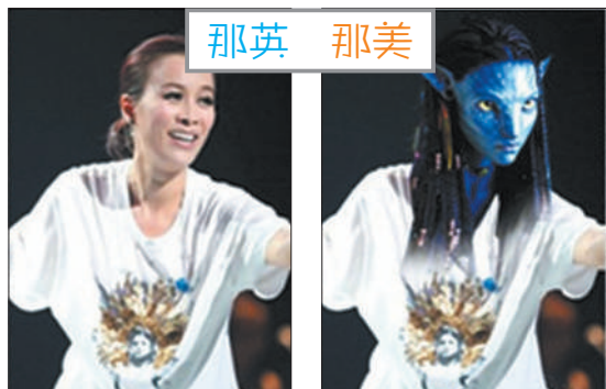
那英和《阿凡达》其实也可以有关系(网友PS图)。