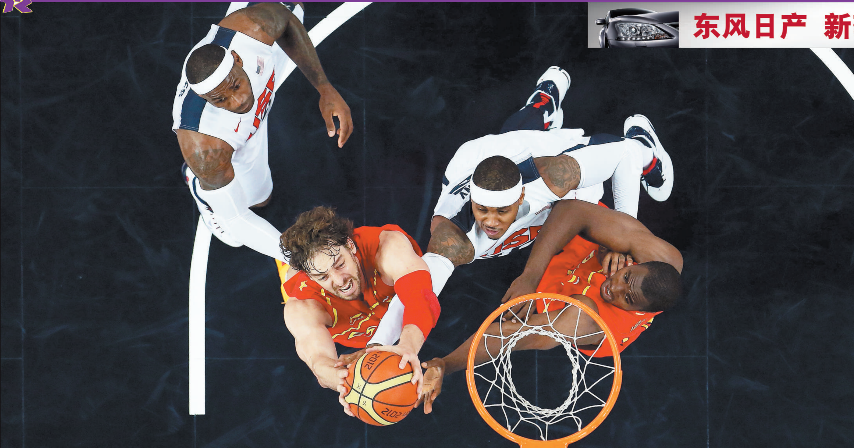
大加索尔在詹姆斯(左)和安东尼的夹防下上篮,前者得到西班牙队最高的24分。