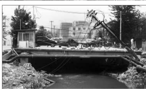
停车场长百余米,宽近10米,像一个巨大的盖子,扣在西沙河上。

洪水到达此处后,大量从上游冲下的垃圾等物,将停车场下方的河道北侧堵死。受阻的洪水水位迅速上升,冲向两岸,灌入岸边小区和中医院。