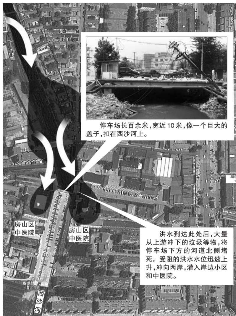
房山区中医院河道上停车场示意图