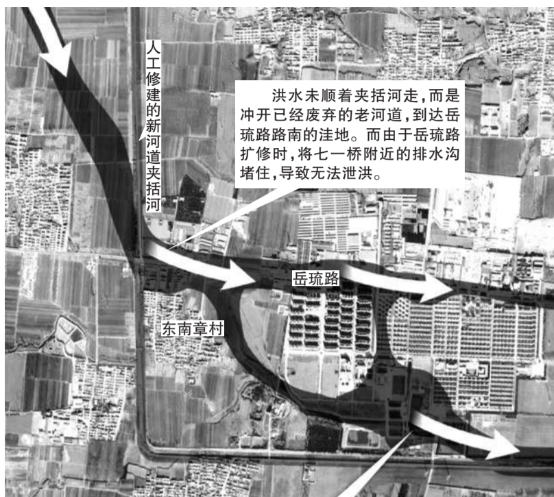
韩村河镇废弃老河道洪水倾泻示意图

洪水未顺着夹括河走,而是冲开已经废弃的老河道,到达岳琉路路南的洼地。而由于岳琉路扩修时,将七一桥附近的排水沟堵住,导致无法泄洪。