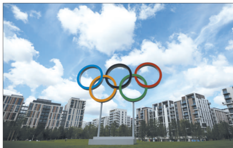
▲奥运村(左)在奥运结束后,将改造成公租房;运动员使用过的所有物品(右)都将挂牌出售。这是伦敦奥组委事先就制定的经济策略。