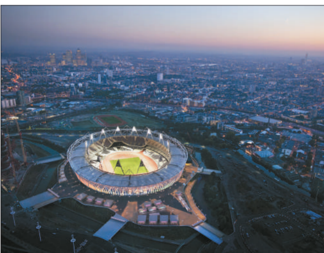
以伦敦碗为代表的奥运场馆赛后都会有新的用途。