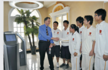
诺贝尔奖得主巴里·马歇尔访问爱迪并与学生交流