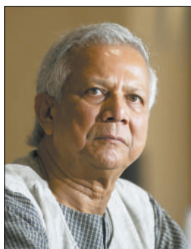
诺贝尔和平奖获得者尤努斯

新京报讯(记者金璇)昨日,在“2012如新大师趋势论坛”上,诺贝尔和平奖获得者、小额信贷创始人穆罕默德·尤努斯称,中国小额信贷需要专门法规支持才能顺利进行。