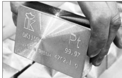
交易市场上的铂金块。