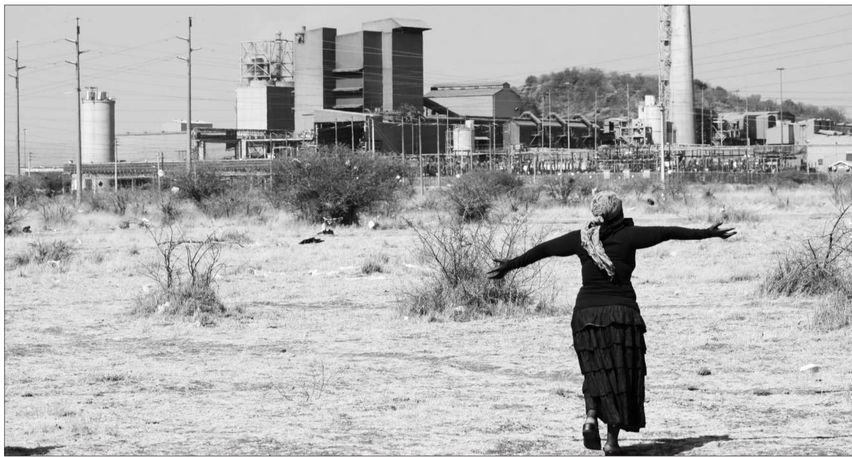
19日,南非隆明铂矿附近,一名当地妇女一边痛哭一边张开双臂。上周四,矿工与警方的冲突导致34名矿工死亡。