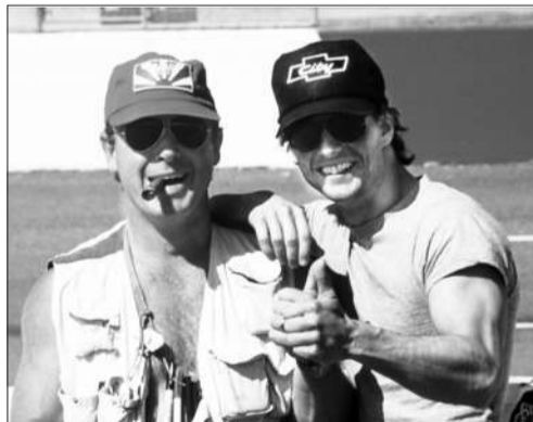
托尼和汤姆·克鲁斯(右)。

近30年来，托尼·斯科特产量一直很稳定。他擅长拍惊险动作片，视觉语言上也爱用爆炸、追踪等元素，他导演的作品有很强的视觉冲击力，而《全民公敌》《怒火救援》等片也呈现出动感十足、剪辑风格凌厉等特点。从2006年开始，托尼的《时空线索》《地铁惊魂》《危情时速》都引进到内地。也是中国观众最熟悉的好莱坞导演之一。