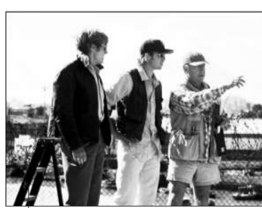
托尼在片场指导皮特(中)演戏。

托尼与许多大牌演员频繁地合作。与他合作最多的是曾经获得奥斯卡影帝的丹泽尔·华盛顿，他们一共合作了《红潮风暴》《时空线索》《危情时速》等五部影片。布拉德·皮特也与斯科特合作多达三次。汤姆·克鲁斯扬名世界则是因为1986年与斯科特合作的《壮志凌云》。此外威尔·史密斯、布鲁斯·威利斯、凯拉·奈特莉也都曾与他合作过。