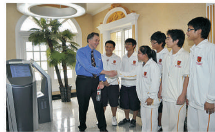
诺贝尔奖得主巴里·马歇尔访问爱迪并与学生交流