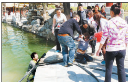
4月8日,拐杖哥(左一)救人一幕。