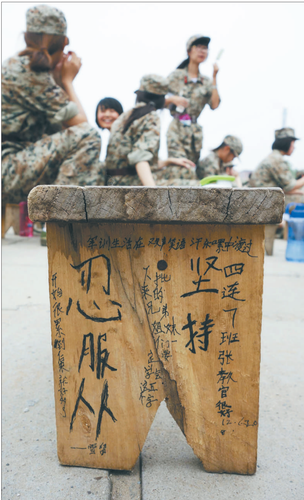
前日,怀柔学生军训基地,来这里军训的学生每个人都会发一个小板凳,许多学生都会在板凳上“留言”,“一代一代”积累下来,逐渐形成“板凳文化”。