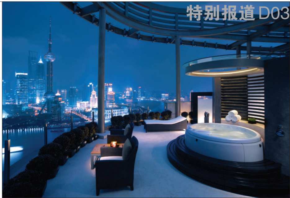
上海外滩茂悦大酒店拥有美丽的270度外滩黄浦江视野。