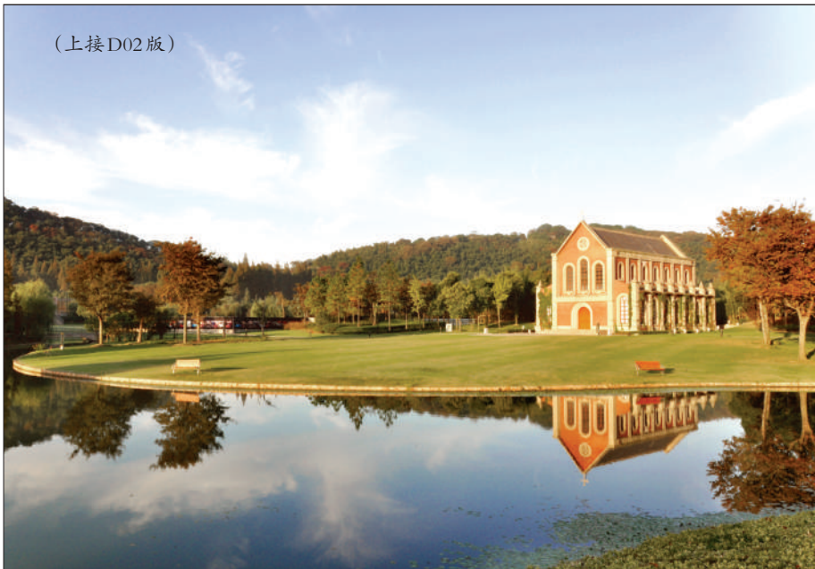
上海世茂佘山艾美酒店就在山脚下,拥有美丽的月湖。