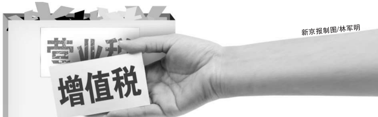
新京报制图/林军明

在试点改革工作期间,地税部门将通过网站、12366纳税服务热线和面对面等多种方式提供纳税咨询,对纳税人咨询问题限时回复。