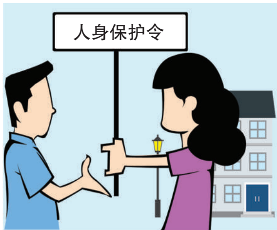
安全保护 禁止被申请人在距离申请人住处、单位等场所50米或200米内活动。