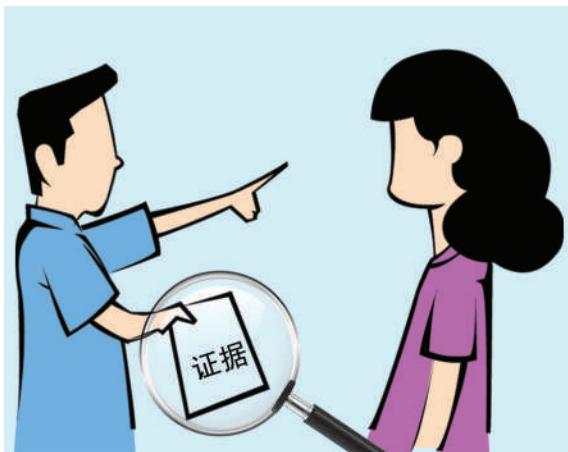
举证规则 被告人否认但无法举出反证,且无其他证据佐证,法院可推定为加害人。