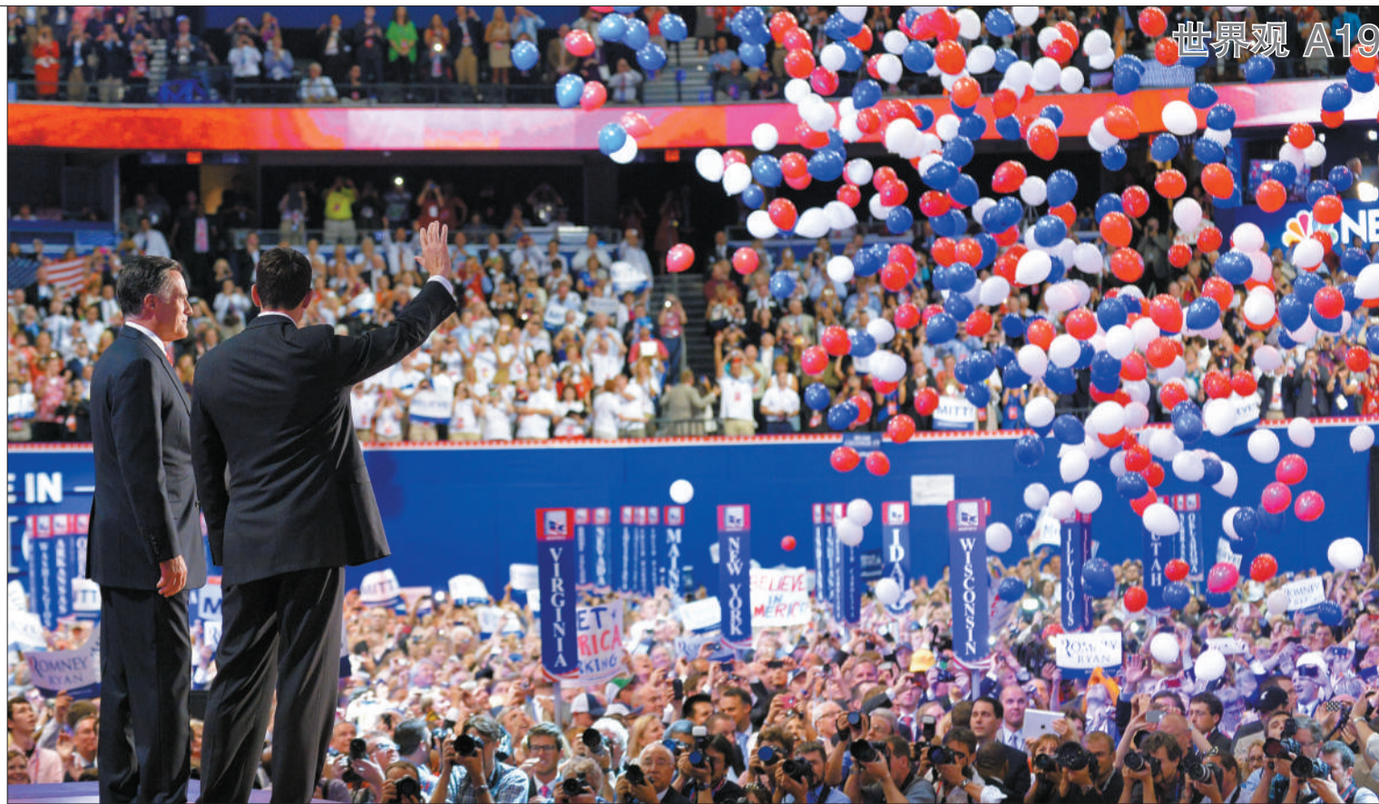
8月30日,美国佛罗里达州坦帕市,共和党总统候选人罗姆尼及其副手瑞安参加共和党全国代表大会。

“三年多前,奥巴马当选总统。他高谈阔论希望、改变,大家都哭了……直到我发现,现在美国还有2300万人没有工作……奥巴马总统,你打算怎么办?”前几日,在美国共和党全国代表大会上,好莱坞硬汉影星伊斯特伍德对着一把空椅子,指责奥巴马“无所作为”。