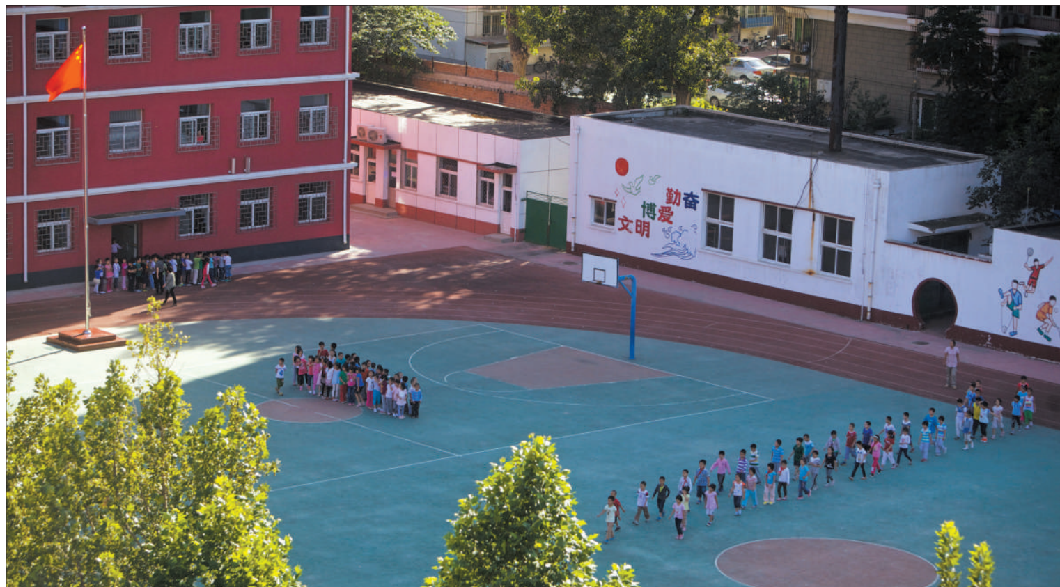
昨日下午，通州东方小学西校区孩子们正在上体育课。有家长反映，该校限制孩子课间去操场活动。

通州区教委小教科工作人员昨日证实，此前曾接到家长的反映并进行调查，但没有发现东方小学有限制学生活动的情况。此外教委体美科工作人员表示，该校达到中小小学生每天一小时校园体育活动规定的要求。