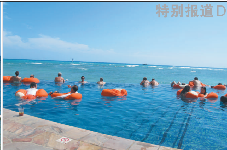
游客在酒店外的海里学习冲浪(左图),酒店的室外游泳池与大海连在一起(右图)。