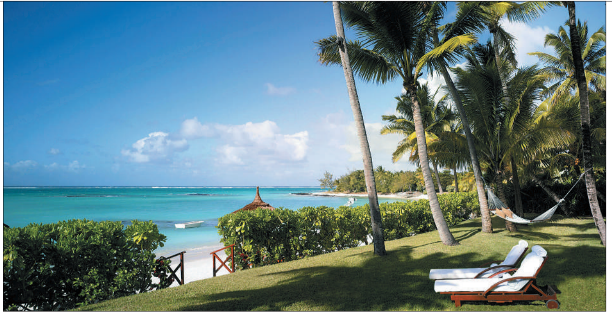
毛里求斯奢华国际度假酒店One&Only Le Saint Géran。