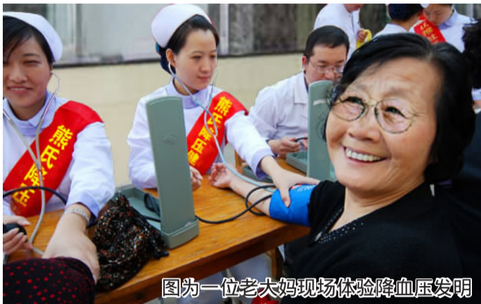
图为一位大妈现场体验降血压发明

几分钟后,外国友人纷纷惊呼“心里舒坦,头晕消失”。半小时后测量血压,发现血压降低数多个值。新发明的熊氏降压健心仪,从此一举成名。(注:在比利时参展获奖后,中国专利部门正式授