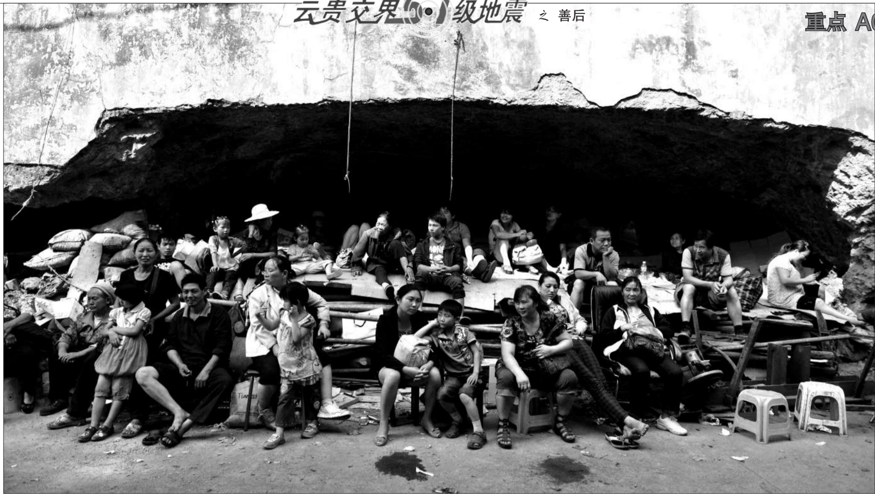
昨日,云南彝良地震震中洛泽河镇,灾民正在等待转移。