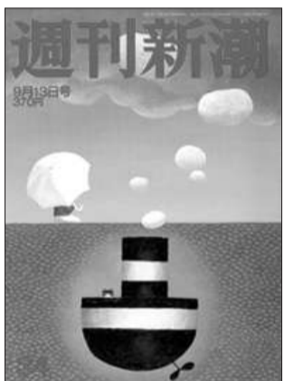
日本《新潮周刊》 政治八卦

亚洲各国将渐渐变成福利国家？这是最新一期《经济学人》关注的焦点。报道认为，随着一些主要亚洲国家经济取得长足发展，这些国家的民众开始向政府要求更多福利，如养老金、医保、失业保障等，这促使这些国家政府不得不从创造财富转为建立福利国家。