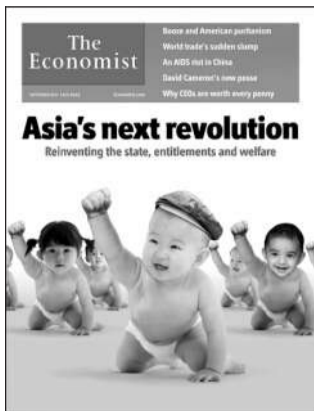
英国《经济学人》 福利亚洲？

亚洲各国将渐渐变成福利国家？这是最新一期《经济学人》关注的焦点。报道认为，随着一些主要亚洲国家经济取得长足发展，这些国家的民众开始向政府要求更多福利，如养老金、医保、失业保障等，这促使这些国家政府不得不从创造财富转为建立福利国家。