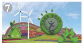
西单西南角:“节能减排”