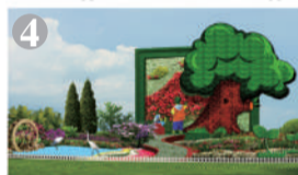
东单东北角:“生态文明”