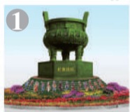
西单西北角:“民族团结”