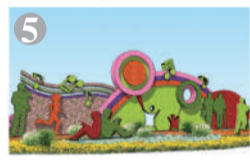
建国门西南角:“幸福生活”