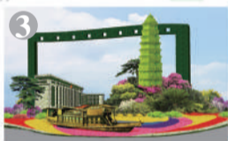
东单西北角:“光辉历程”