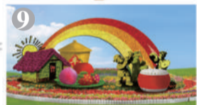
东单西南角:“蒸蒸日上”