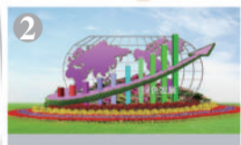
西单东北角:“绿色发展”