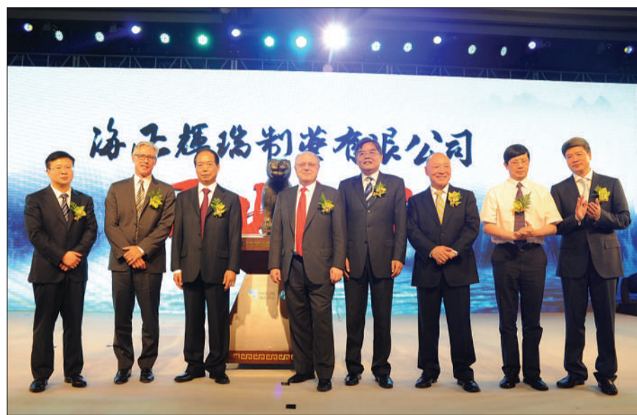
昨日,辉瑞公司与海正药业宣布双方合资组建的海正辉瑞制药有限公司正式成立。