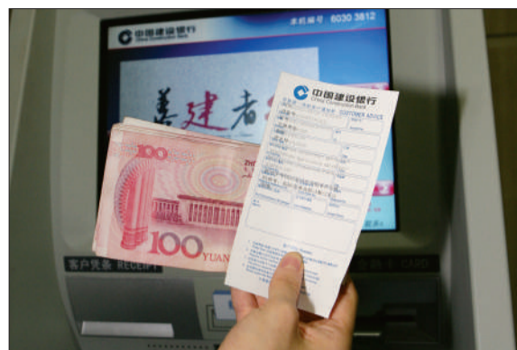
昨日,建行工作人员演示ATM取款打印钞票冠字码。

据了解,北京的银行业已经将实行假币追溯提上议事日程。目前,部分银行已准备对自助机具进行相关升级改造,今后可打印冠字码的ATM机将增加。据了解,建行还酝酿在柜面办理存取款业务时也提供打印冠字码的服务。