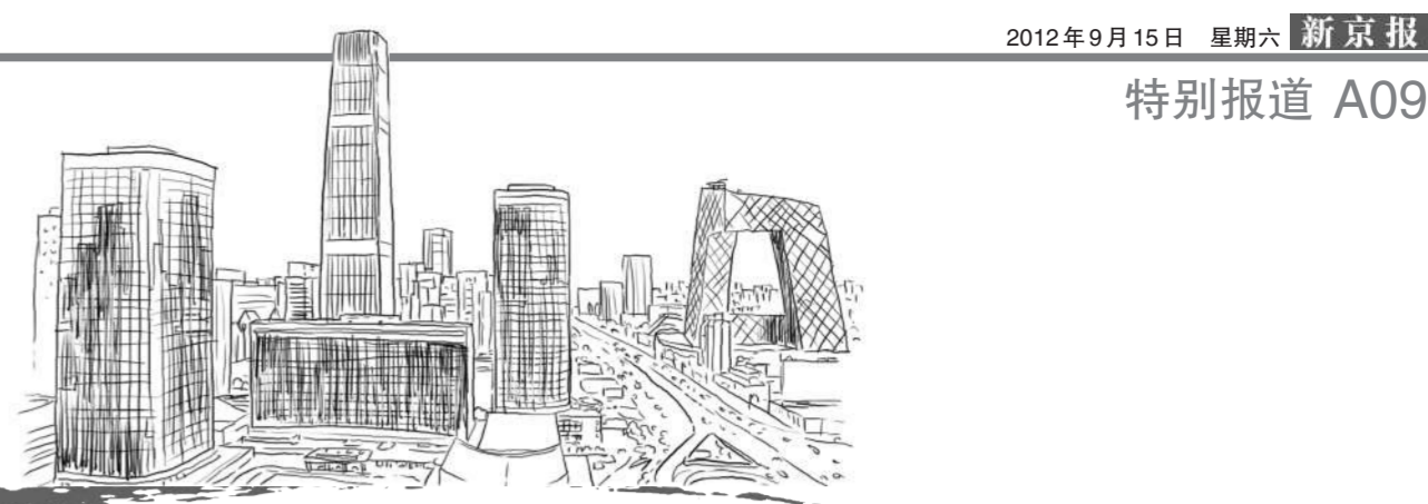
迎接十八大 记者基层行【第4期】之 CBD 写字楼