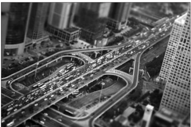
7月12日,国贸桥上,车流不断。