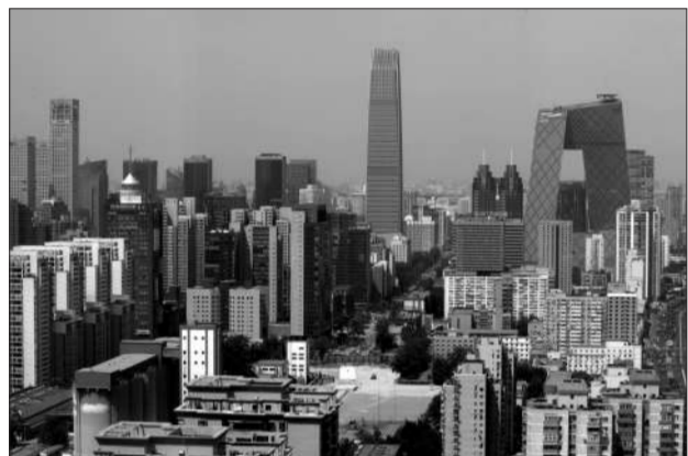
9月14日,CBD核心区。