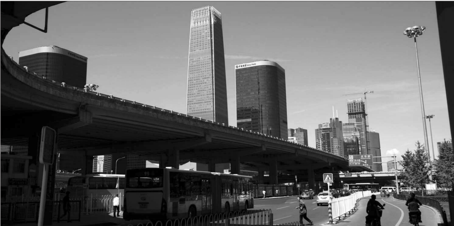
9月14日,CBD核心区,已成为国际商贸中心。