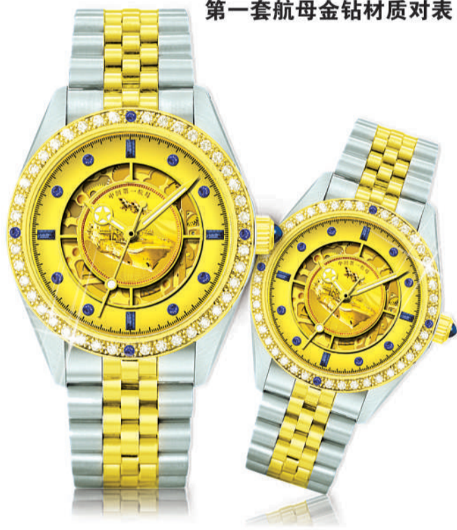
男表:佩戴它,彰显男人浩瀚大海的广阔情怀