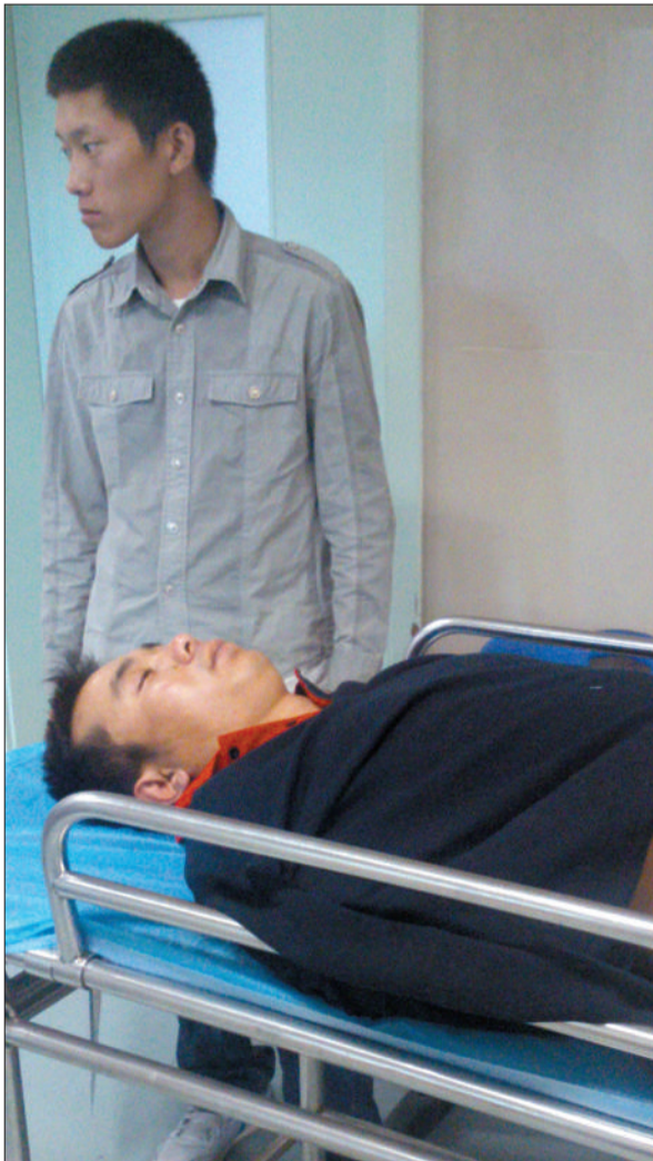
昨日,望京街道一名保安躺在担架床上,他在协助执法时被黑摩的司机扎伤。