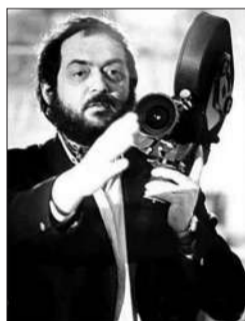
好莱坞的异类天才 导演库布里克。