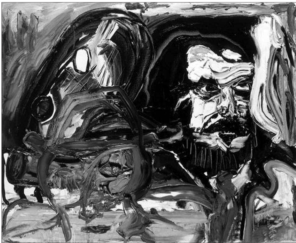
画家 Jonathan Meese 为偶像库布里克所绘的画像。