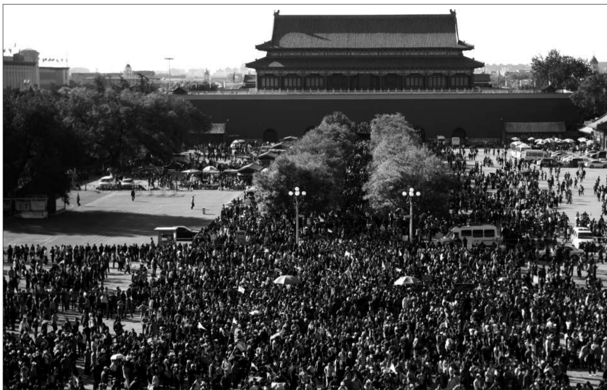
去年10月2日,故宫午门外,等待进入故宫的人流拥挤在广场上,当天故宫开门时间提前1小时。