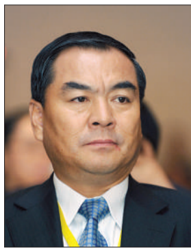
平安银行新任行长邵平