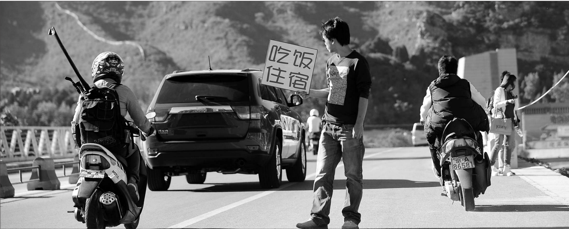
昨日上午,十渡景区一名男子举牌揽客。7·21大雨后,十渡的游客比往年少了许多。

为保证鲜肉的供应安全,市食品办和市工商局表示,丰台、海淀等工商执法人员已检测100余个鲜肉样本,对水分、瘦肉精等进行检测,未发现不合格。其间一旦在检测中发现水分、瘦肉精超标,禁止入市交易,对厂家立案查处,情节严重的清退出所有市场,同时凡未进行冷藏运输的鲜肉也一律禁止进入市场销售。