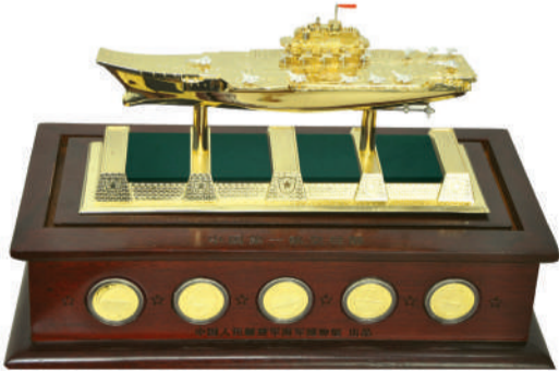
金玉“中国航母”全身浇盖999纯黄金,以中国至高的精湛技术按照1:1000的比例极致打造,底部为象征海洋的0.6公斤和田玉,底座镶嵌5枚从未发行过的“航母纪念勋章”,全方位展示了中国航母的威武雄姿。

1:1000“中国航母金玉模型”,令世界瞩目 首次采用顶级精湛技术、以636套模具,按照1:1000的比例极致铸造。舰体、指挥塔、对空雷达、螺旋桨、近防武器、舰载机、直升机等1000多个零部件微缩后,经过上百位军事专家、航模专家及工匠反复研究摸索,手工安装要精确到毫厘之间,其难度之难以想象,有人形象的比喻到:这比造一艘真的航母也差不到哪去了,霸气十足、价值更是无与伦比!