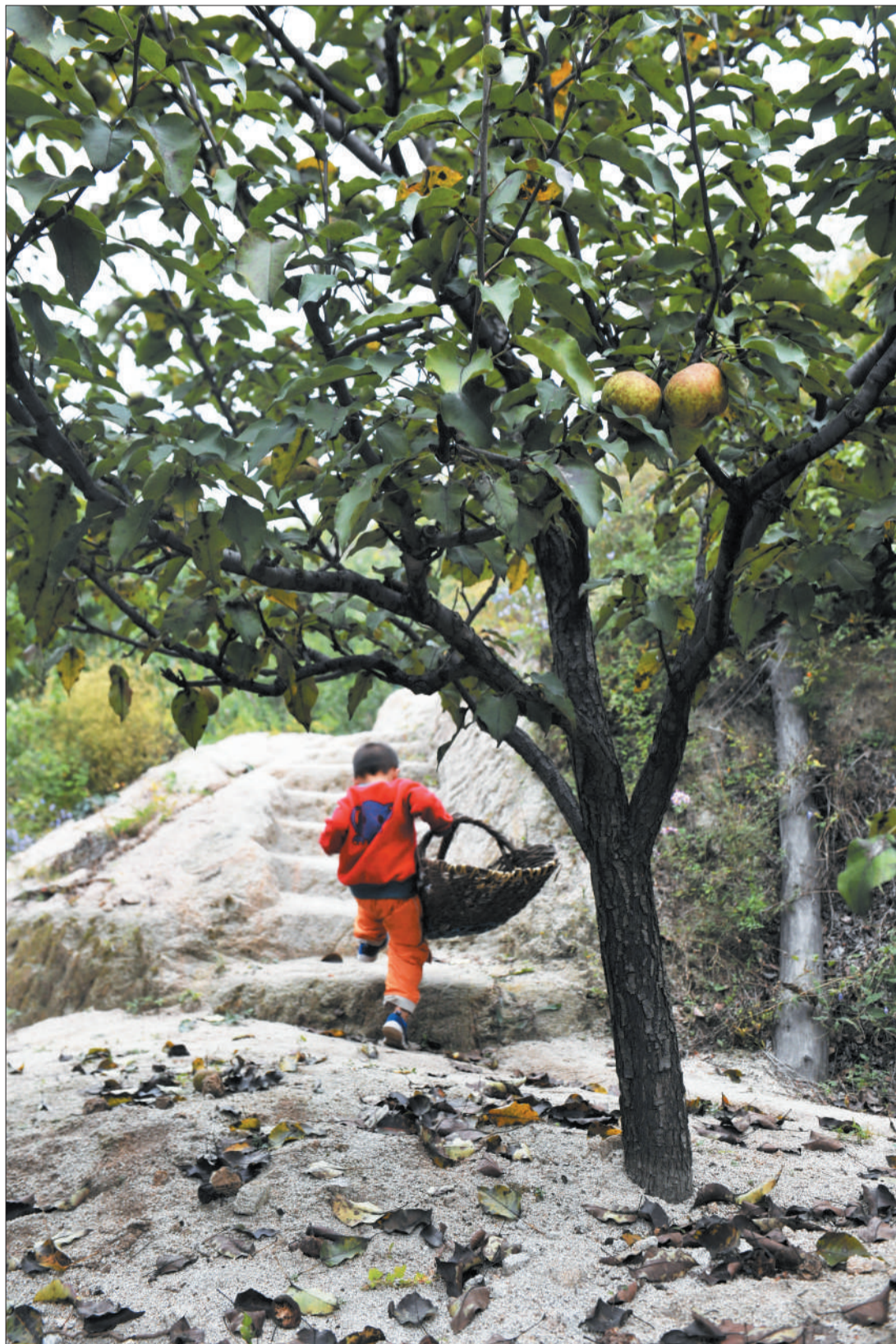
延庆的秋天，秋果秋花，山野人家，最为迷人。

详见B02、B03、B06、B07版