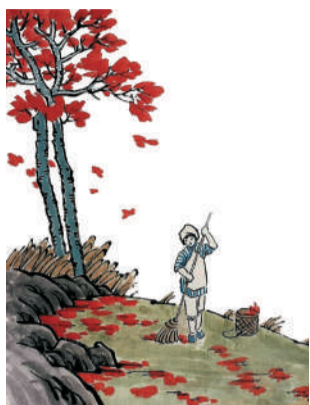
丰子恺作品