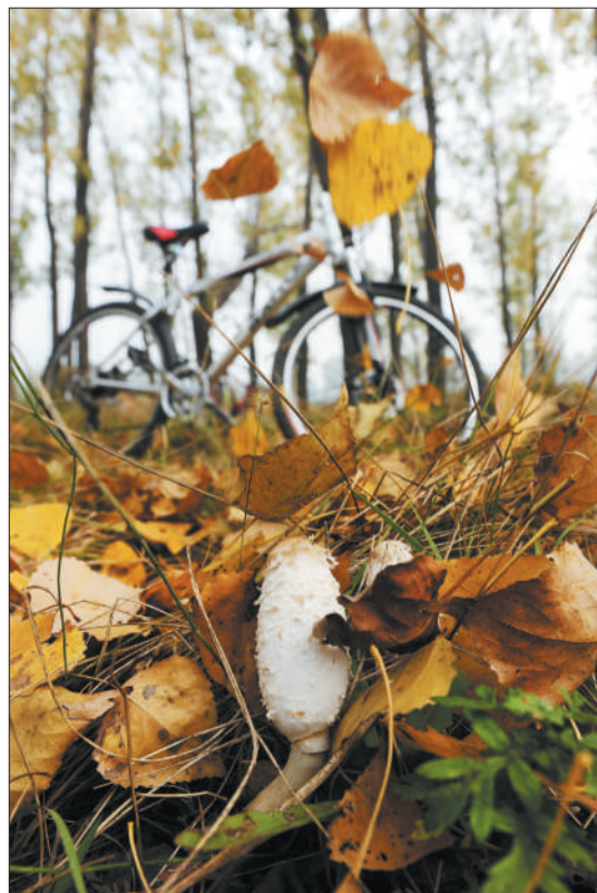
落叶为京郊骑行带来诗意。