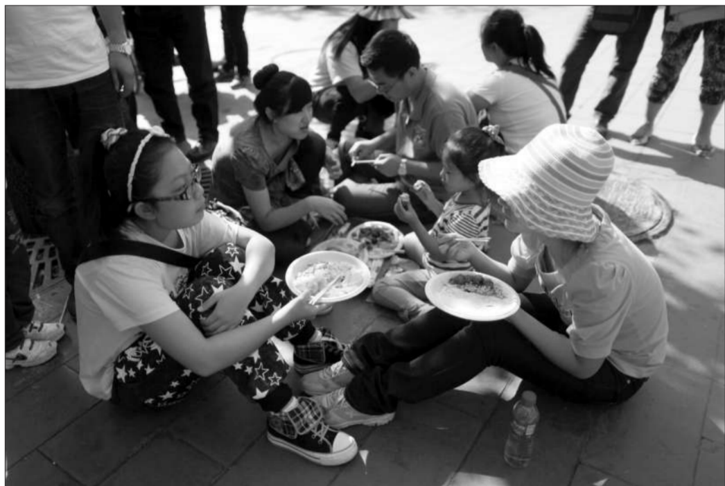
昨日,天安门城楼下,游客们席地而坐吃午餐。

A04-A05版采写/新京报记者 张永生 李禹潼 刘保奇 林野 汤旻 郭超 魏铭言 刘春瑞 廖爱玲 实习生 李晓波