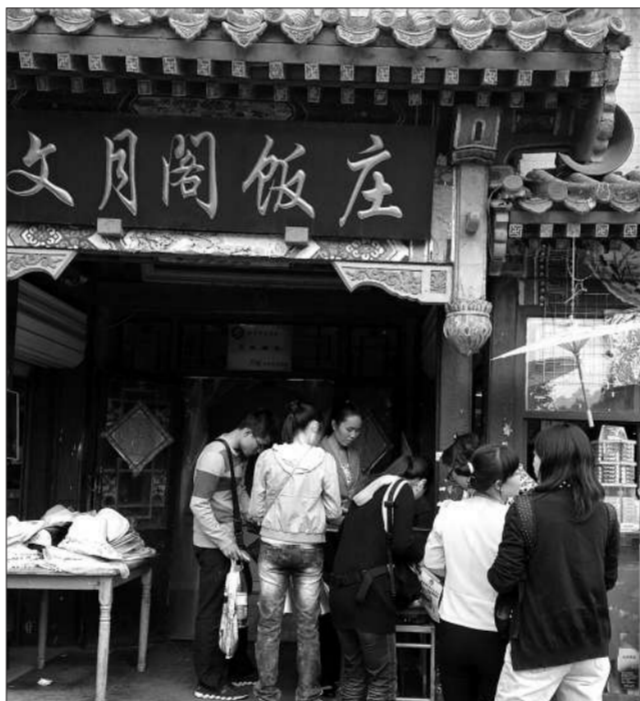
颐和园文月阁饭庄门前,游客正在排队买玉米。