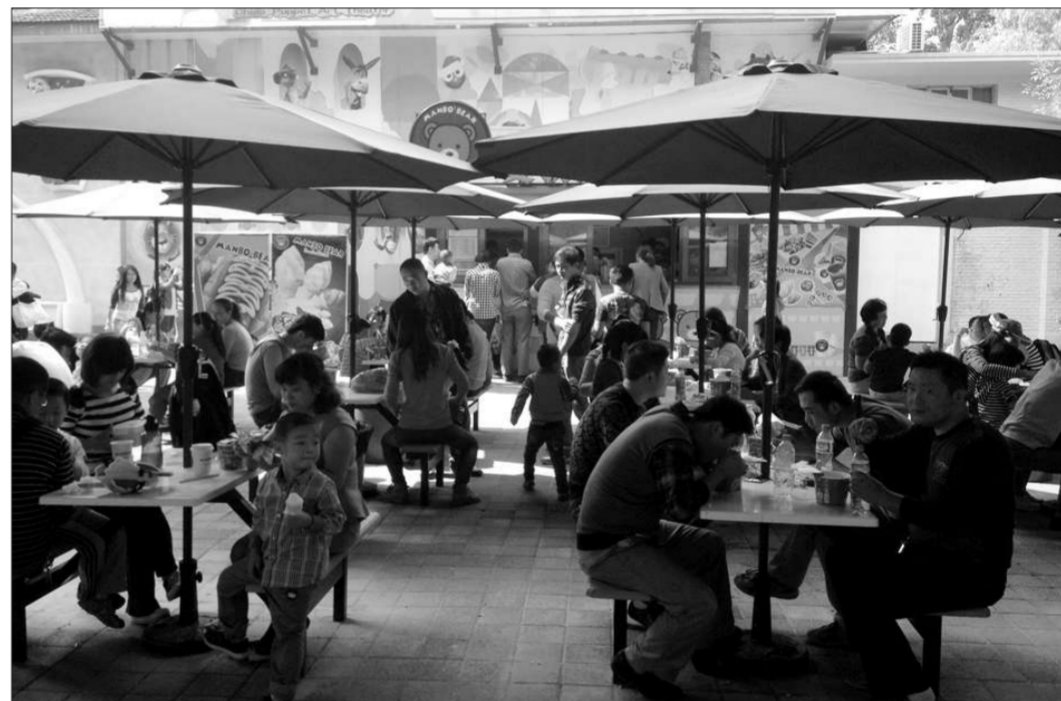
动物园内,一处供游客吃饭的地方被占满。