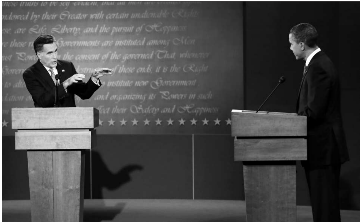
3日，美国科罗拉多州丹佛，罗姆尼（左）在美国总统大选首场辩论上和奥巴马舌战。