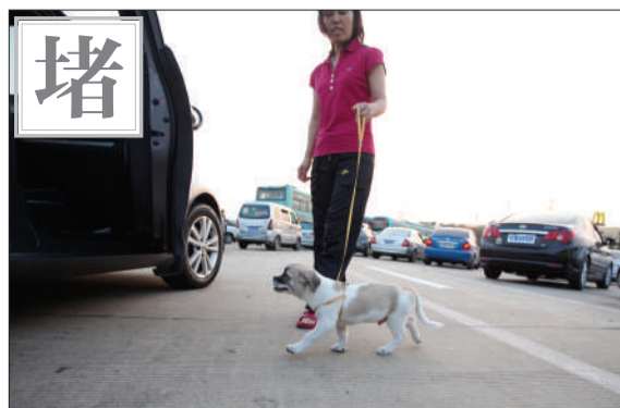
9月30日,深圳机荷高速严重拥堵,一位乘客在遛狗。

国庆期间,北京市公共图书馆累计流通人次近10万人次;另有35.8万人走进剧场观看各种演出。