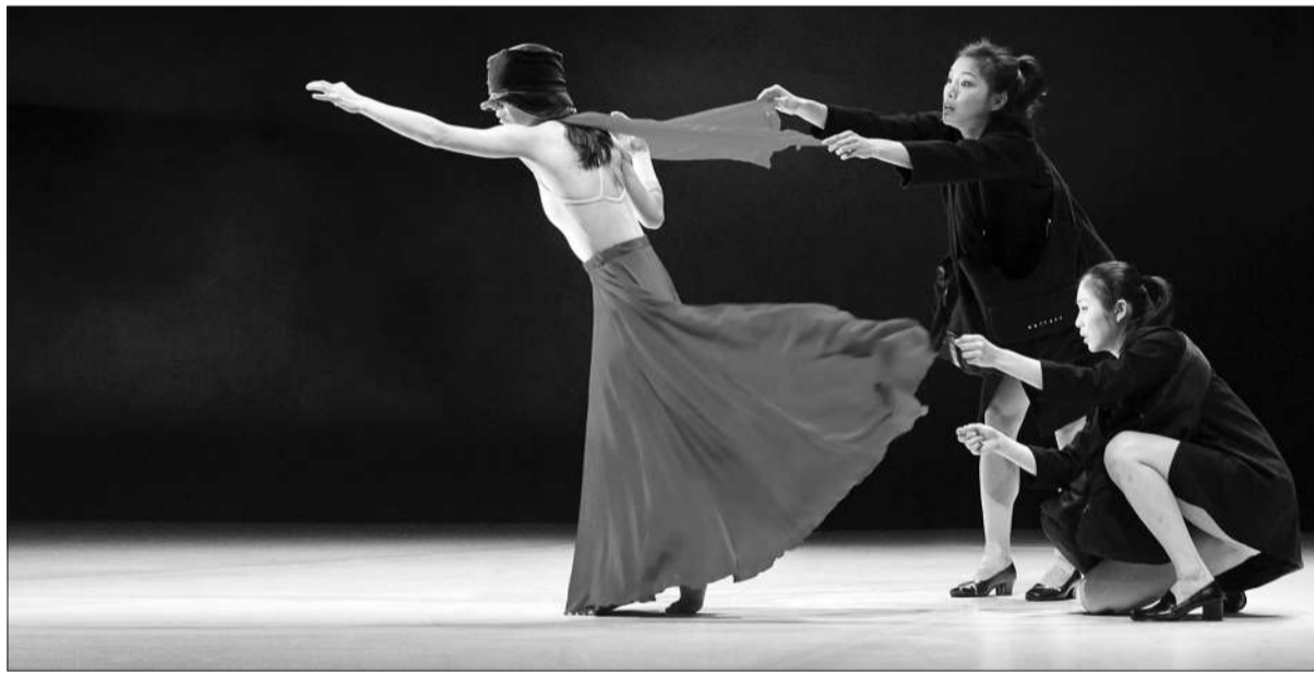
编舞家布拉瑞扬的《出游》从一个梦游女子的状态反映现代人的精神情绪。