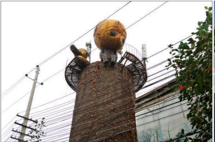
工厂老烟筒上也装饰了艺术雕塑。