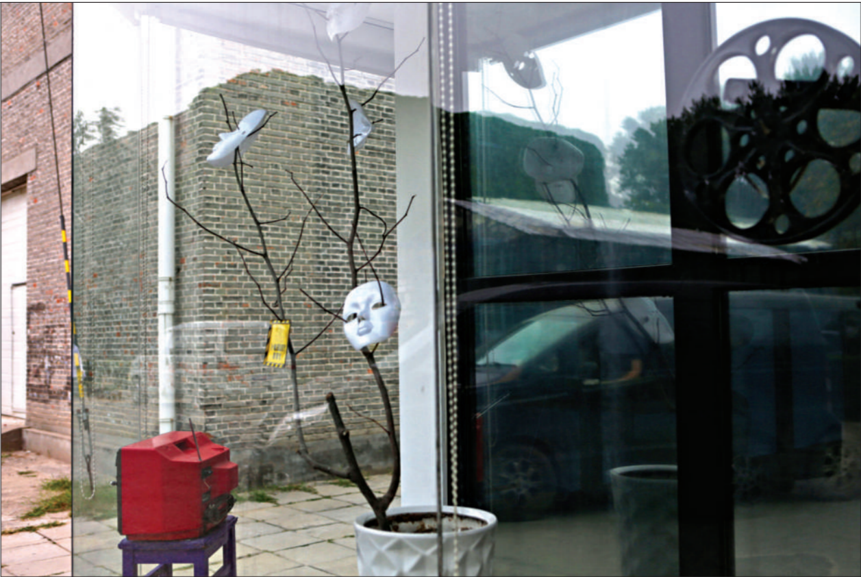
酒厂艺术区内,一家影视工作室的橱窗,里面摆放的老物件与倒映的灰色厂房仿佛已融为一体。