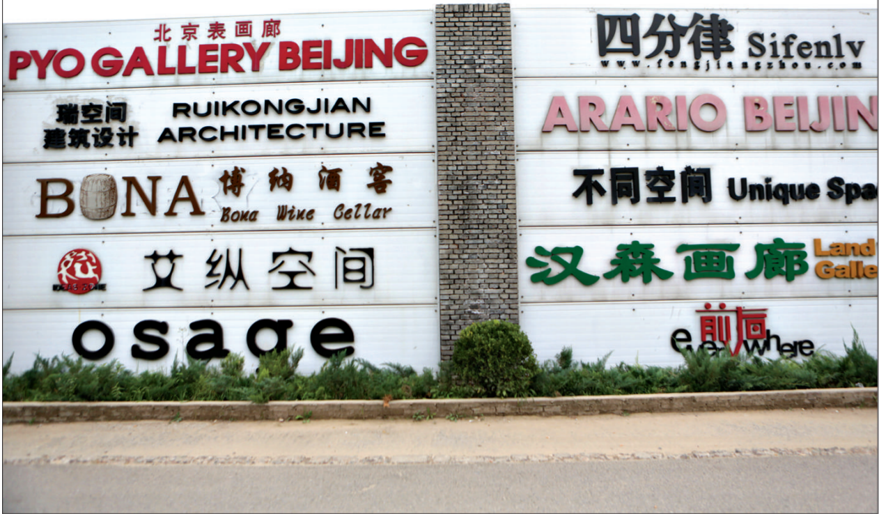
酒厂艺术区门口,挂满了驻园艺术机构的招牌。