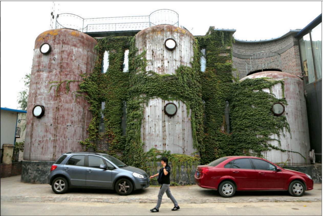
酒厂艺术区的规划和建设充分利用了酿酒厂原有的厂房和设备,并对园区环境进行了适当改造。