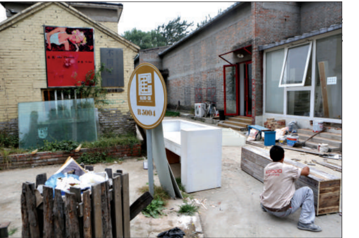
艺术区内,一位工人正忙于装修。