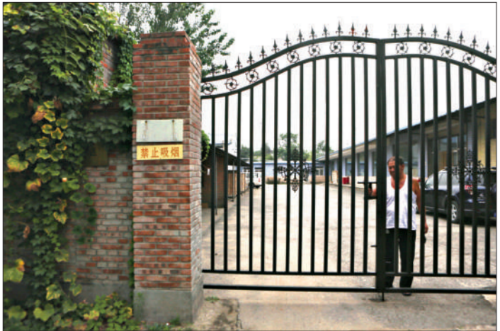
整个艺术区只有一道简陋的酒厂大门与外界相连。

该艺术区自筹建以来,先后有国际著名画廊“阿拉里奥北京艺术空间”、“表画廊”、“程昕东国际当代艺术中心”、“香港奥沙艺术空间”、“旧雨今来轩”等,还有“立方网”、“四分律”、“飘飘人”、“大学生艺术网”等著名设计机构进驻,园中还云集了中央美院的学者教授及一批海归画家、学者,构成了园内多元文化艺术结构和艺术门类的不同碰撞。