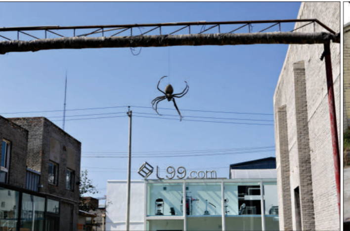
在高处攀爬的蜘蛛雕塑。