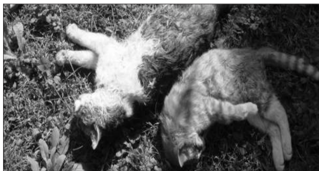
10月5日早上,百旺家苑小区草坪上,躺着两只被虐杀的流浪猫。当日共有5只流浪猫被虐杀。

地点:旧鼓楼大街145号 时间:20日18:00-20:00 演出:张艺德,民谣弹唱 时间:27日18:00-20:00 演出:英伦盒子,吉他弹唱